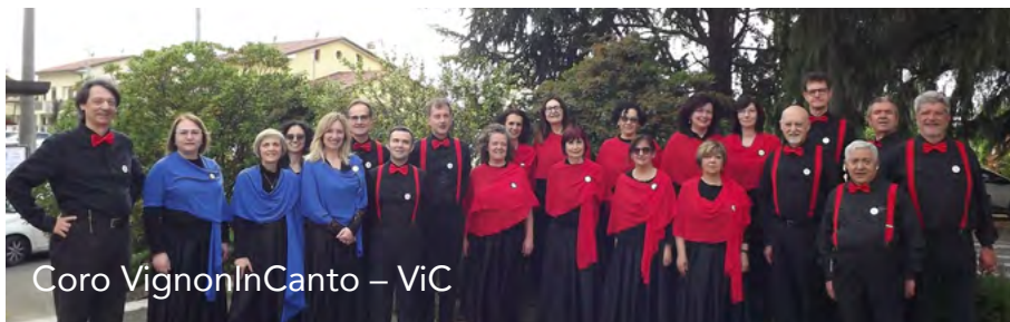
Coro VignonInCanto – ViC