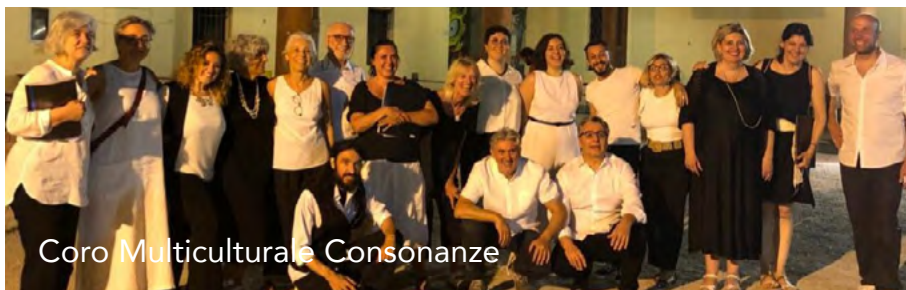
Coro Multiculturale Consonanze