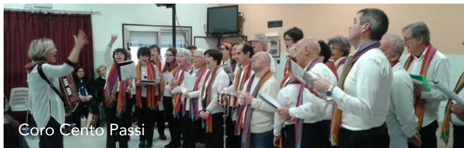
Coro Cento Passi